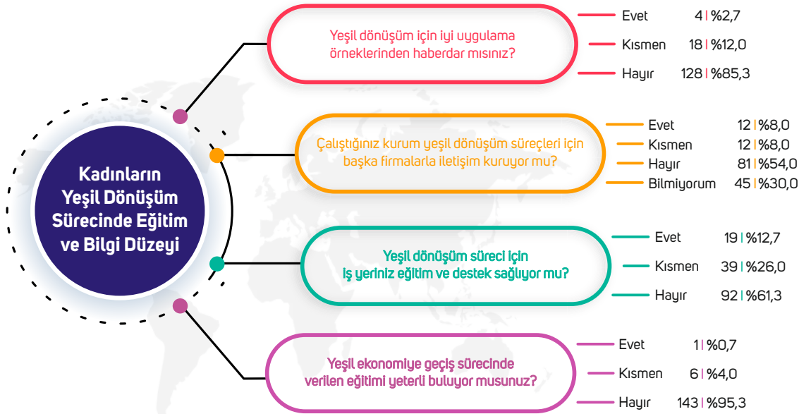
Tablo 5: Kadınların Yeşil Dönüşüm Sürecinde Eğitim ve Bilgi Düzeyi